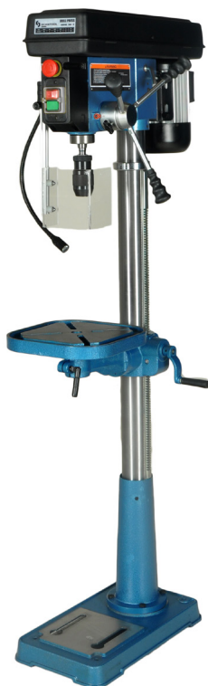
16AEF Article No. 100 76 4000