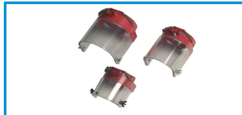
Beskyttelsesskærm Schutzschirm Safety guard