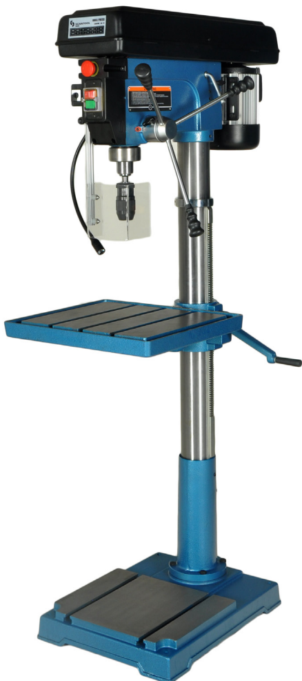
25A Article No. 100 76 6000