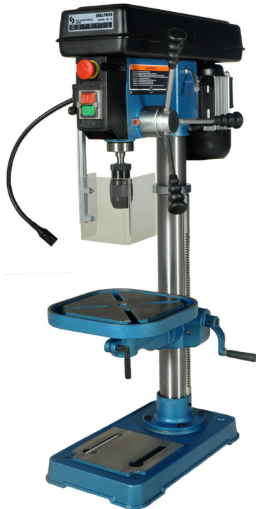
16AE Article No. 100 76 2000