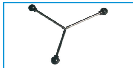
Tilspændingshåndtag Kurbelstange Drill handle