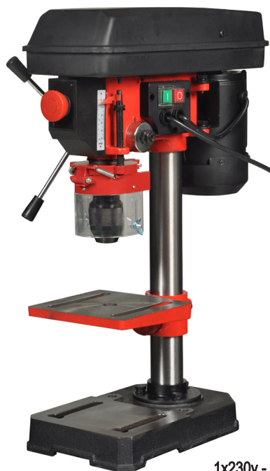
1x230v - 50/60 Hz