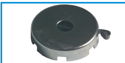
Returfjeder Rückholfeder Return spring