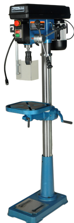
16ATF Article No. 100 76 5000