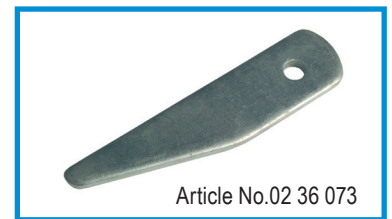
Article No.02 36 073