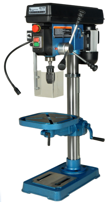
16AT Article No. 100 76 3000