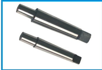
Konus Konus Cone

Accessories for V-belt driven drill presses