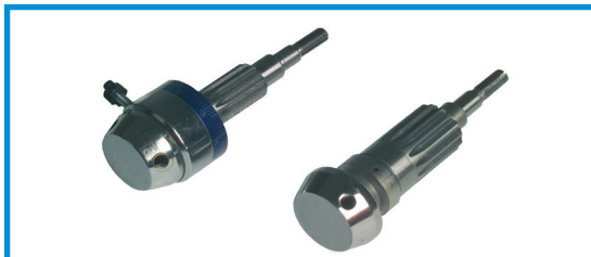
Knop til håndtag Kurbelknopf Center for drill handle